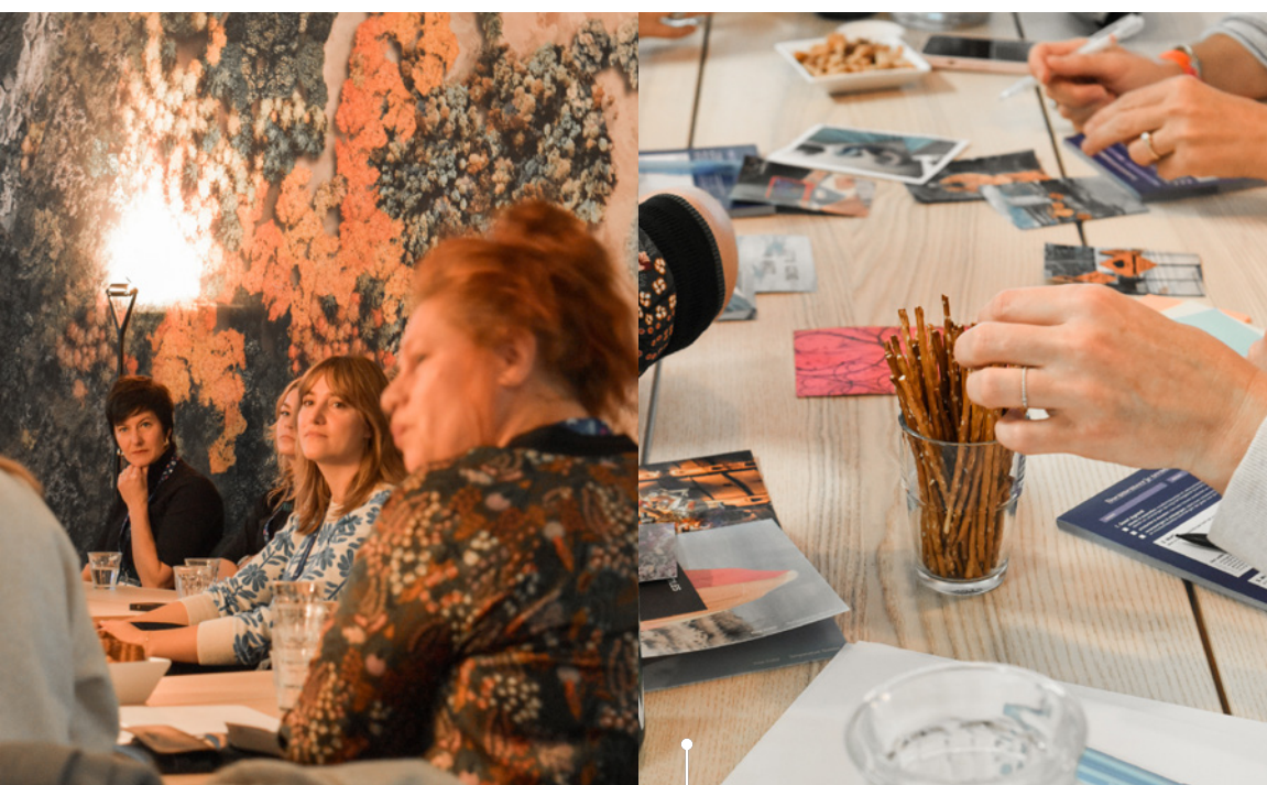
TRENDMASTERCLASS BURO ZORRO X BNS CRISP